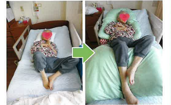
上半身・下半身ともに余計な力が入っているのをクッションを使用し身体を全面的に支えることで身体の力が抜けて関節が伸びる

個人情報保護法に基づき行事写真等の掲載については、利用者の皆様に同意をいただいております。