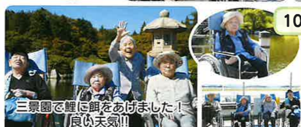
三景園で鯉に餌をあげました! 良い天気!!